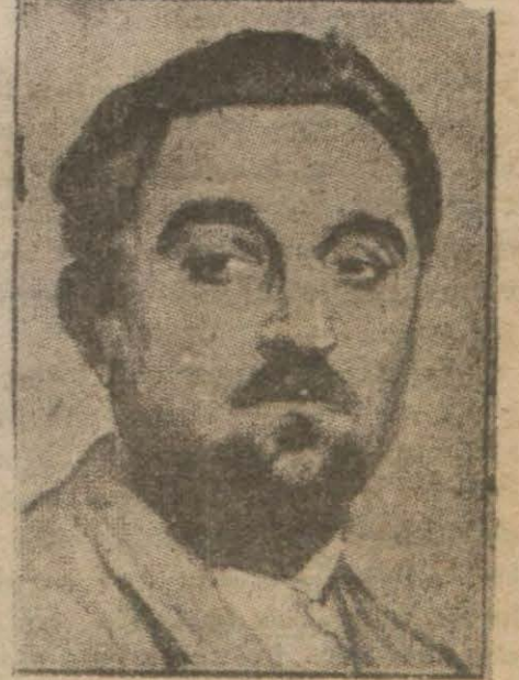
Tayyareci Sovan mak için yaptığı bütün müracaat- lar semeresiz kaldı. Nihayet mahallî Müddeiumu- ( Devamı 11 inci sayfada )