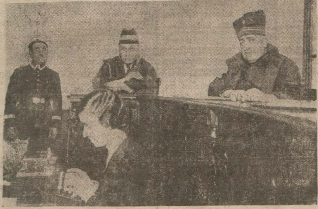
İhtisas Mahkemesi, vazife sırasında, dün bir acı hakikate parmak basmış oldu

Niçin Hakkını Aramadın Denilince Acı Bir "Eşraf," Hikâyesi Anlattı