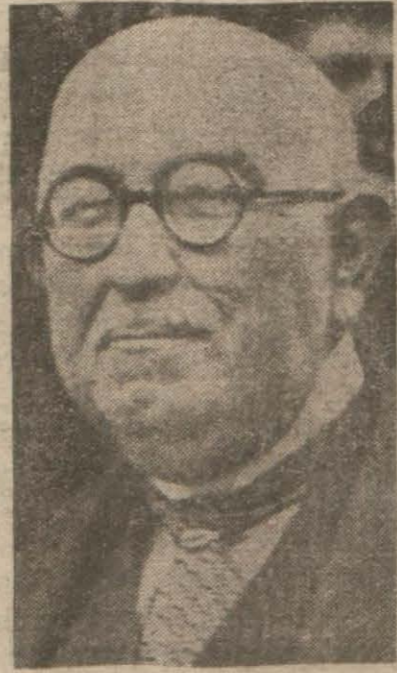
Sabık Hâdiv Abbas Hilmi Pş.

Mamafih İstanbul Rum cemaati, bugünlerde çıkacak olan yeni Esnaf Kanunu münasebetile beyanı memnuniyet etmektedir. Bunun sebebi, Yunan tabiiyetini haiz kimselerin terki meslek etmesile bunların yerinin yerli rumlar tarafından doldurulacağı ümit ve emniyetidir.