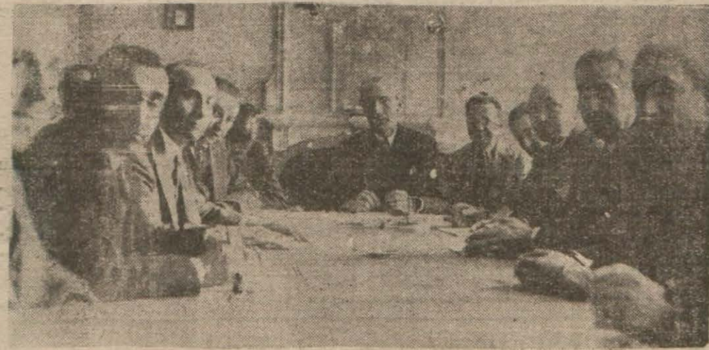
Muhtelit Mübadele Komisyonu Umumi Heyeti

İstanbul Rumları, Çıkması Beklenen Yeni Kanundan Memnun Görünüyor